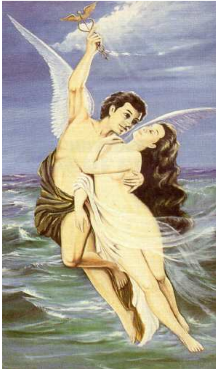
“O casal” do livro o Matrimônio Perfeito